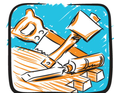
Teicneolaíocht an Adhmaid