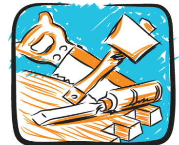
Teicneolaíocht an Adhmaid