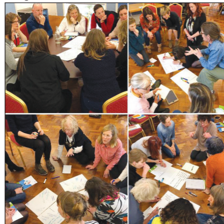
Múinteoirí Amharc-ealaíne & Déantóirí Dearaí ag plé féidearthachtaí & deiseanna don phleanáil chomhoibriú.

Measúnú Rangbhunaithe 1' á chraoladh sna seachtainí beaga romhainn agus tá ceann eile le dul ar an aer mí Mhárta seo chugainn 2019.